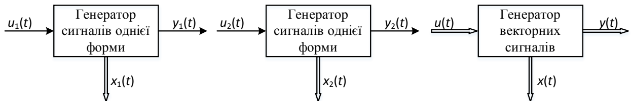
Рис. 1. Генерація двох повідомлень.

Розглянемо систему, яка генерує два вихідних повідомлення y_1(t) та y_2(t) (рис. 1).