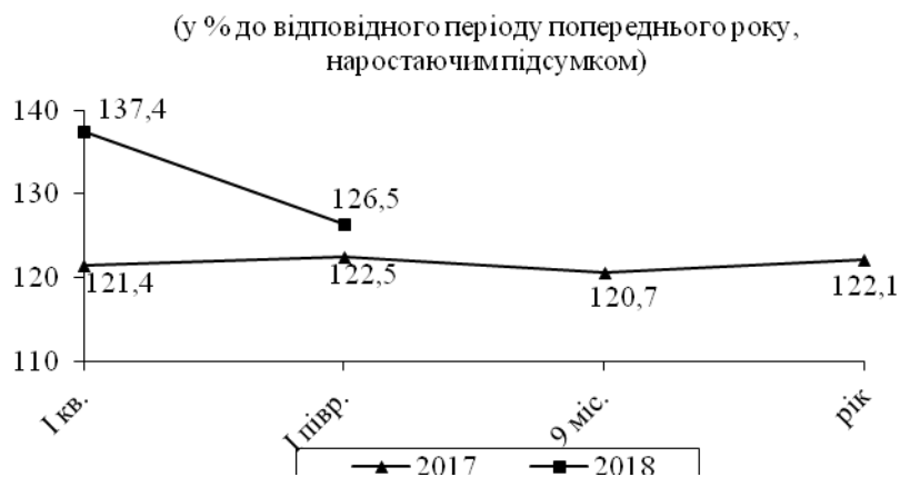
Рис. 1. Індекс капітальних інвестицій [10]

На капітальний ремонт активів спрямовано 14,6 млрд. грн капітальних інвестицій (7,1% від загального обсягу) (рис. 1) [10].