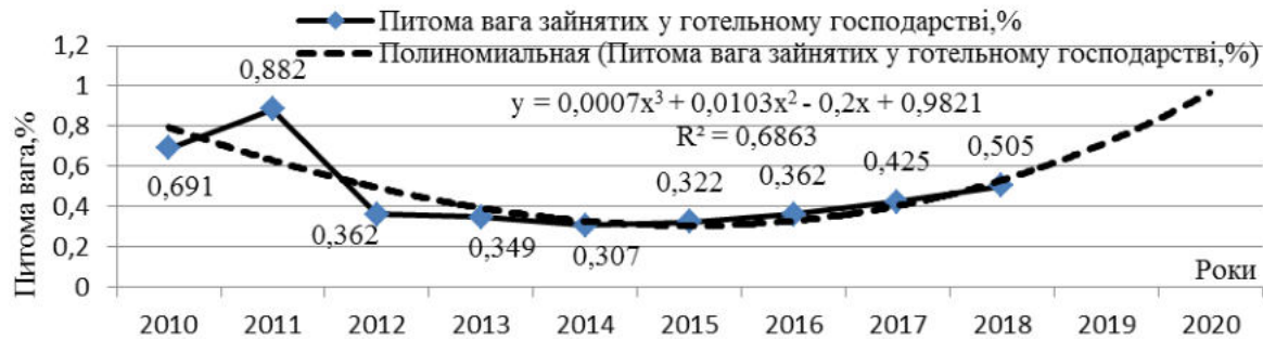
Рис. 3. Динаміка показника зайнятості населення на підприємствах готельного господарства в загальній чисельності зайнятого населення України, %

На рис.3. надано динаміку зайнятості населення на підприємствах готельного господарства, яка коливається в межах 0,307-0,882%. Найбільший відсоток зайнятості спостерігається в 2011 році і складає 0,882%. За даними прогнозування цей показник має у 2020 році зростати, але його значення не досягне 1,0%. Європейські показники зайнятості населення в готельному господарстві [5] складають від 2 до понад 6 відсотків працездатного населення кожної країни. Таким чином, за показником зайнятості населення в даній сфері Україна є аутсайдером.