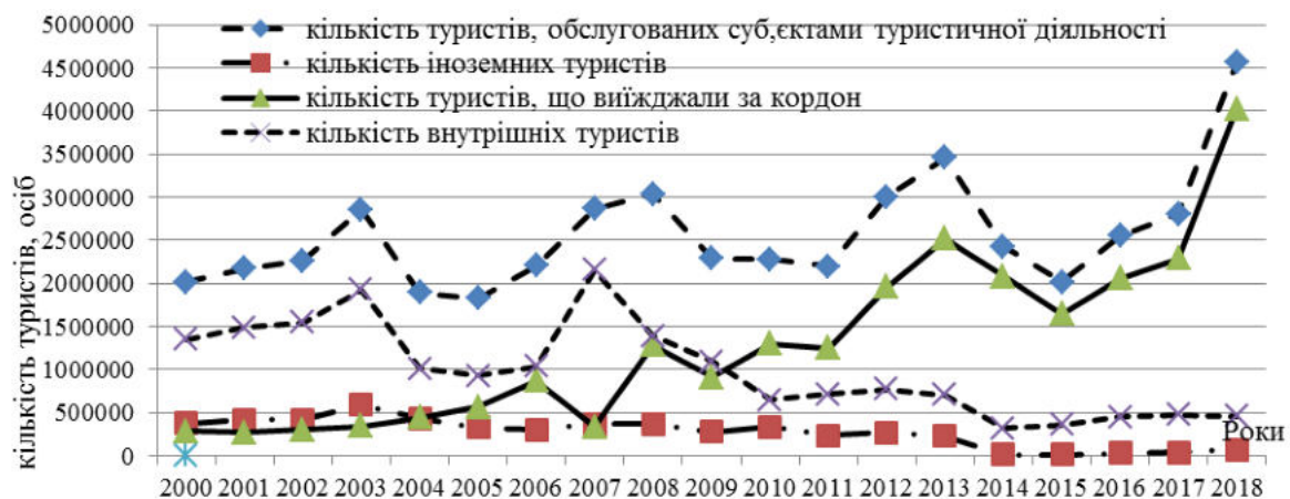
Рис. 1. Динаміка туристичних потоків в Україні в 2000 – 2018 рр., осіб

Динаміку кількості туристів, обслугованих суб'єктами туристичної діяльності України надано на рис. 1.