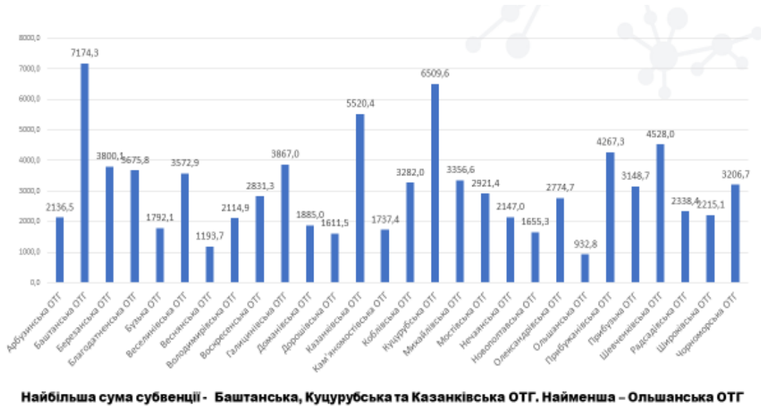
Рис. 1. Розподіл субвенції між ОТГ Миколаївської області в 2018 р.

Якщо ж поглянути на кількість та вартість проектів, то побачимо дещо іншу картину (рис. 2):