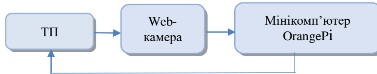
Рис.2 Структурна схема комп'ютерно-інтегрованої системи контролю якості

Перед початком роботи необхідно запрограмувати відео системи, яка включає в себе калібрування камери.