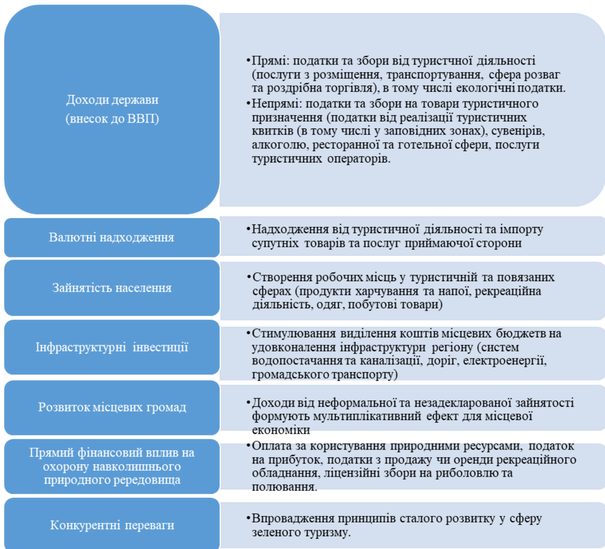
Рис. 1 Економічні переваги від впровадження та розвитку зеленого туризму Доповнено автором на основі [13, 17]

Поняття зеленого туризму виникло у 1980-х роках та означало туризм, який передбачав відвідування природних територій і мінімізацію згубного впливу на навколишнє природне середовище. Однак з часом поняття зеленого туризму набуло більш широкого значення – туристична діяльність природоохоронного спрямування. Зелений туризм, екотуризм, агротуризм, сільський туризм – це форми спеціалізованого туризму, що з'явилися ще в минулому столітті, стаючи все більш важливими напрямками туристичної галузі у всьому світі. Зміни у поведінці та способі життя потенційних туристів у поєднанні з загальною турботою про довкілля та широке впровадження концепції сталого розвитку в усі сфери життя людини – все це фактори, що призвели до розширення цих ринкових видів туризму (табл. 1).