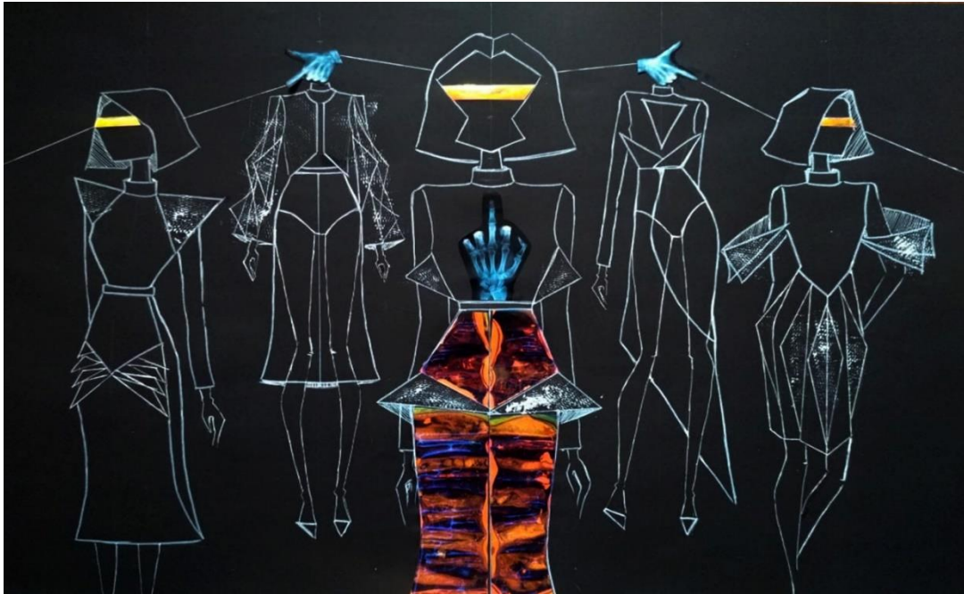
Рис.5. П'ятифігурна композиція авторської колекції одягу

Дана колекція одягу має загальне художньо-стильове рішення та має можливість взаємозамінності його частин в залежності від призначення, що свідчить про систему комплект у колекції (рис. 5).