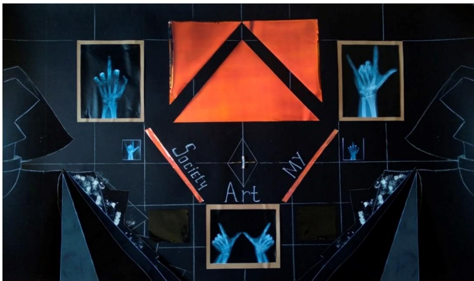
Рис. 4. Асоціативний колаж психологічної та колористичної відповідності

Для відображення ідеї колекції та передачі психоемоційного настрою, було створено асоціативний колаж психологічної та колористичної відповідності (рис.4).