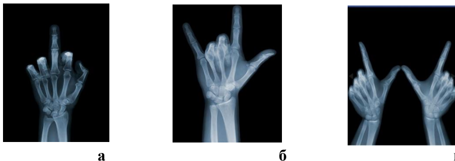
Рис.1. Аналіз символів у творчості Ніка Візі та асоціативне сприйняття текстури фото картин на трикотажному боді з ефектом рентгенівських променів

Наскрізь – це слово дуже добре характеризує роботи фотографа, про що він і сам говорить: «Люди живуть у світі, де повним-повнісінько зображень. Вони переживають про власний зовнішній вигляд, про свій одяг, машини, будинки, телефон та інше. Я ж у свою чергу, поставивши перед собою мету, намагаюся порушити всю цю ідилію зовнішньої оболонки. Знімаючи шар за шаром, оголюючи підкладку предметів, інтригую, розширюючи кордони добре знайомих образів, заглянувши всередину яких, розумієш те, що знаходиться глибоко всередині – лякаюче та прекрасне» [9].