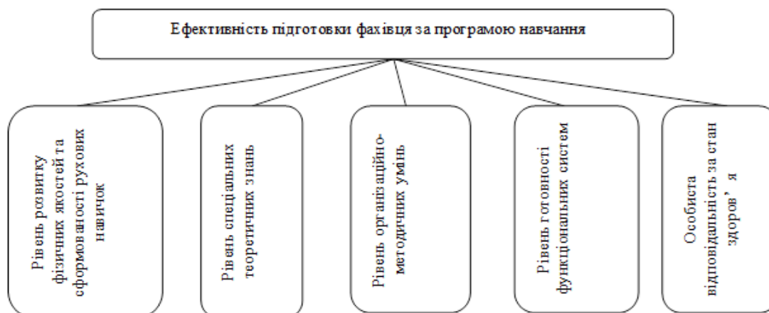
Рис. 1 Узагальнена система критеріїв ефективності засвоєння програми фізичного виховання

Для ефективності підготовки фахівця необхідно враховувати рівень функціонального стану (рис. 1).